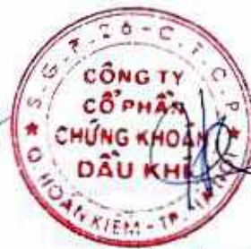
PHÓ GIÁM ĐỐC PHỤ TRÁCH